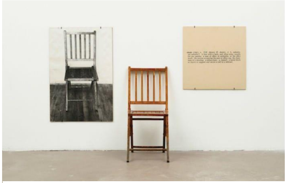
Joseph Kosuth, "Bir ve Üç Sandalye" (1965)

“Dil, yalıtılmış bir öznenin “yalıtılmış” yaratıcı-ediminin sonucu değildir. Dil, kurumsaldır; ve bu da onu öğrenilen bir pratik olarak, toplumsal, eş deyişle de özeneler-arası alanın bir ürünü kılmaktadır. Birey, bu ürünü bir araç olarak kullanır ve bu aracın sağlayıcısı da toplum ya da bir başka deyişle öznelerarasılıktır. Bu araç ya da araçlar ile donanmak, bir geleneğe doğmak ya da bir geleneğe uyarlanmaktadır. Bu yaklaşım, aynı zamanda “gelenek”in sürdürülmesi ile “şimdi”deki eylemin ‘biricikliği’/‘özgünlüğü’ arasındaki gerilime ilişkin bir sorgulamaya da kapı açmaktadır. Wittgenstein’a göre, kurallar ve onların oluşturduğu oyunlar, etkin olarak içerisinde